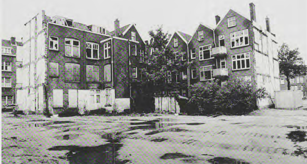
'14 drugspanden is wel genoeg'

In Spangen wordt al langere tijd geprobeerd een meervoudige aanpak van de grond te krijgen. Al in 1988