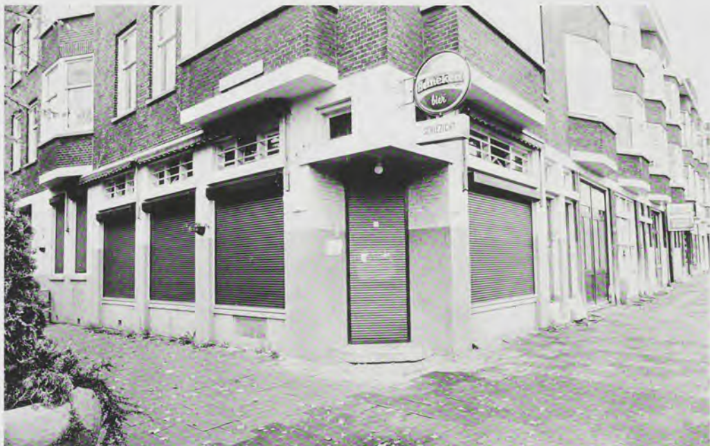
Een drugs-café kan beter worden gesloten

klaagden bewoners hun nood bij het stadhuis. Burgemeester Peper vroeg de toenmalige projectgroep stadsvernieuwing maatregelen te nemen. Dat leidde tot de vorming van een overlastcommissie, waaraan verschillende instellingen in de wijk deelnamen. Uit een zelfgemaakte inventarisatie bleek dat er 78 overlastgevende panden in de wijk waren, met concentraties van panden in de delen van de wijk met een fijn vertakt crimineel netwerk. Zo konden gebruikers op ieder gewenst moment met elk willekeurige betaalmiddel in de wijk Spangen terecht. Op grote schaal werd hiermee criminaliteit geïmporteerd uit andere wijken. Bewoners werden dagelijks geconfronteerd met een enorme overlast en gaven het geloof in de wijk op. Op basis van de inventarisatie is een aanvalsplan gemaakt. Doel was de erkenning door alle partijen dat de overlast alle perken te buiten ging, en dat deze op een zo kort mogelijk termijn bestreden moest worden.