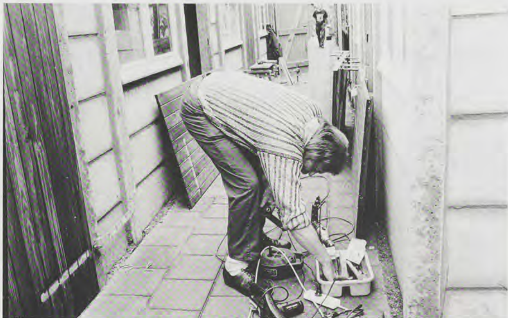
Inbraakpreventie: investering, maar levert veel op.

neerd. Dat ging niet zonder slag of stoot. Het kostte b.v. blaren op tongen en voeten om het GWR zover krijgen een gezamenlijk beleid te formuleren voor sociaal beheer, uitzetting e.a. Na diverse acties van zowel GWR als politie, en via natuurlijk verloop, resteerden zo'n 14 drugspanden in de wijk.