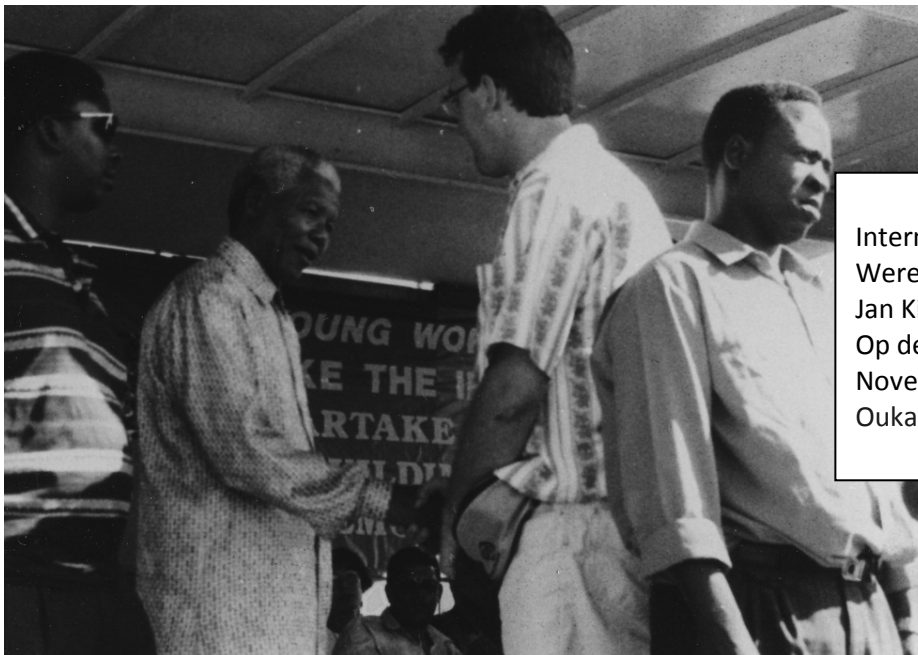
Internationale KAJ Wereldraad 1995 Jan Kint bij Nelson Mandela Op de Openingsceremonie November 1995 Oukasie, Brits, Zuid-Afrika

Formeel stappen dan later in '84 een aantal landen uit de beweging. En Frankrijk wordt de grote trekker om Cardijn in ere te houden. En je krijgt dus ook internationaal twee bewegingen.