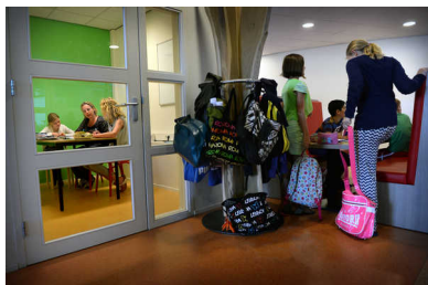
Op basisschool De Ark krijgen kinderen aparte begeleiding in een afgeschermd ruimte.