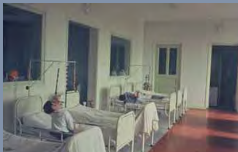
In de jaren tachtig komt er spelmateriaal op de bedzalen.