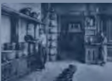
De keuken in de loop van 90 jaar Tot 1978 bevond de keuken zich in het hoofdgebouw. In dat jaar - toen men nog volop geloofde in de toekomst van de inrichting - werd er op het terrein een nieuwe keuken gebouwd. De capaciteit was 800 maaltijden per dag. In 1997 werd de keuken gesloten. Vanaf die tijd worden de maaltijden betrokken uit de keuken van Amarant (ontkoppeld koken).