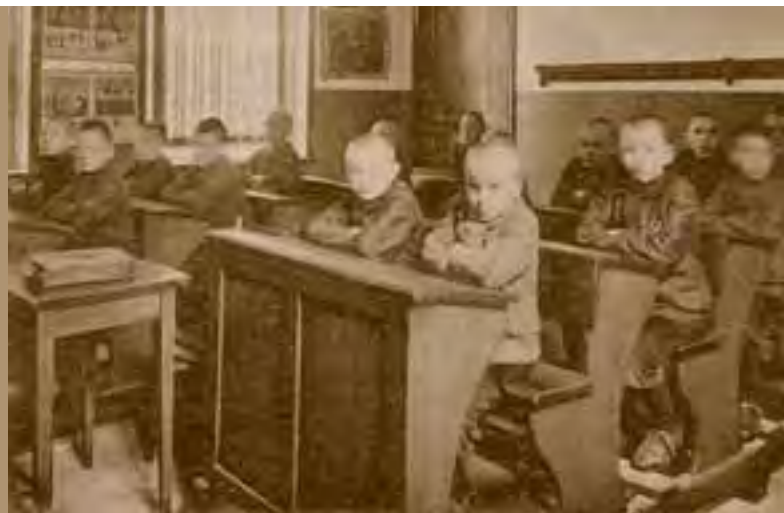
Een klas in 1922.