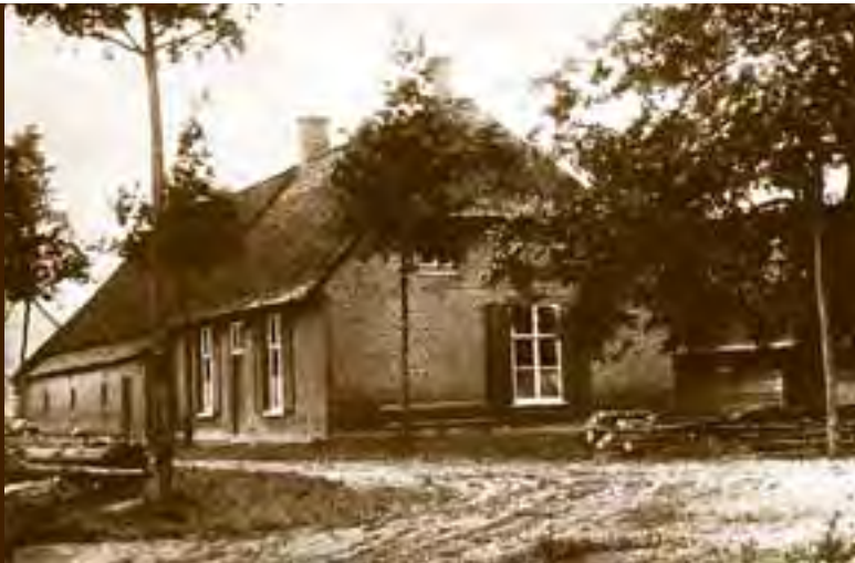
Een van de drie boerderijen uit de tijd vóór Assisië.

Assisië kent vele verhalen. Verhalen die vertellen van de mensen die er soms tientallen jaren leefden en werkten. Verhalen van de familie en bekenden die bij hen op bezoek kwamen.