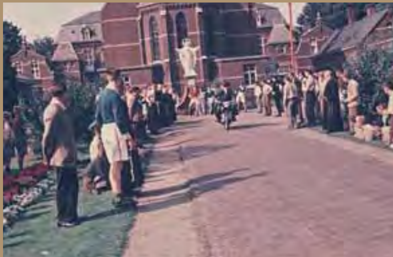
1958, lange tijd werden er jaarlijks wielervedstrijden gehouden.