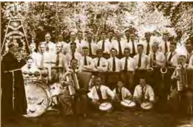
Mondorgelband 'De Merels' Opricht in 1928 en voortdurend uitgebreid. Er was geen feest in huis zonder de club. Ze speelden ook buiten de instelling. In 1947 werd de band omgevormd tot fanfare.