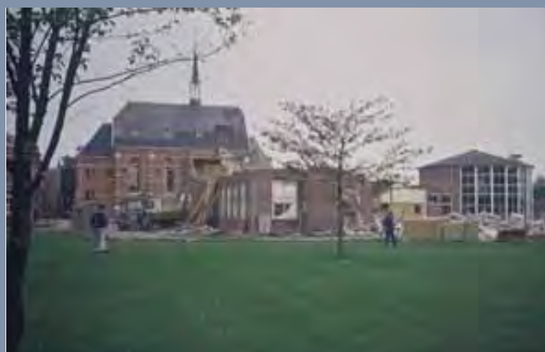
1990, sloop Jozef paviljoen. Helaas sneuvelt de koepel ook.