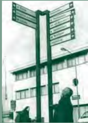
Leven in de lokale samenleving. Een cliënt temidden van de vertokkingen die het gewone leven biedt.