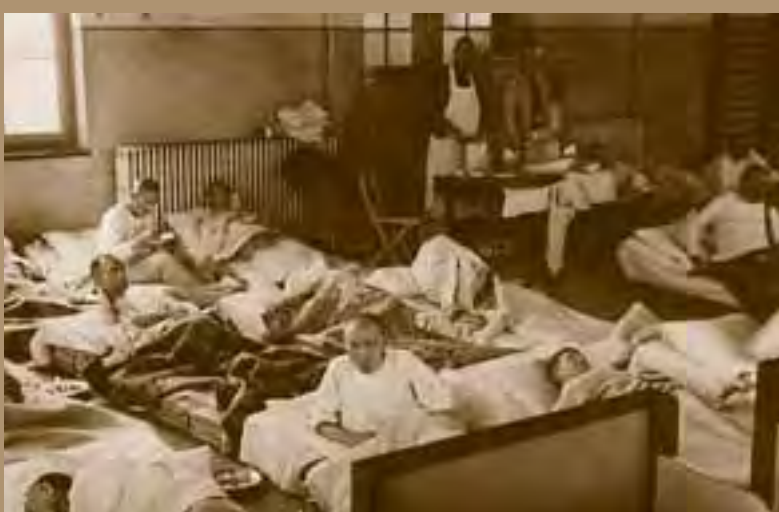
Evacué uit Boekel Tweemaal werden patiënten van Huize Padua tijdens de oorlog opgevangen in Assisië. Voor de 250 patiënten moesten in allerijl de school,