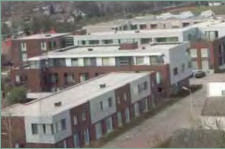
Wooncentrum dr. Maassen: Modern wonen en leven.