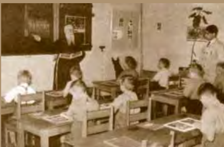
Pater Rector geeft catechismus op school.