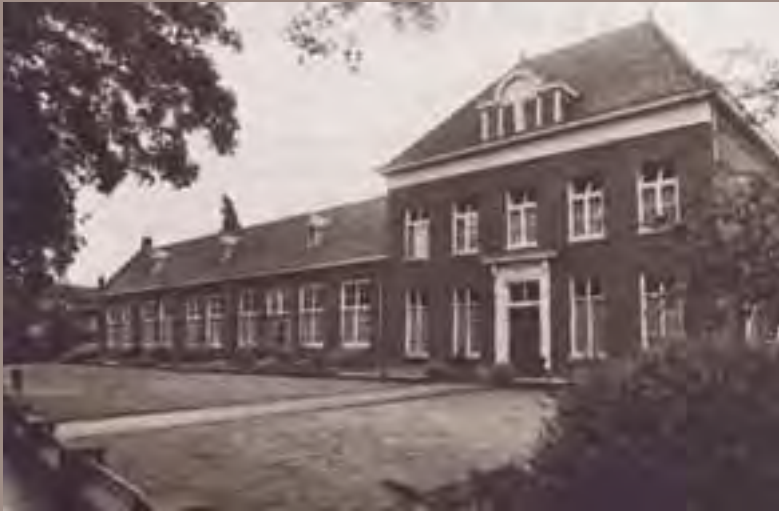
Het in 1975 in gebruik genomen internaatsvervangend tehuis 'Inverte' in Loon op Zand. Later werd elders nieuw gebouwd. Thans in gebruik als openbare bibliotheek.

Het verschil tussen het leven in Assisië en dat erbuiten, werd wel erg groot. Niemand woonde in 1980 nog op een zaal met 25 anderen. Zonder kaste voor je spullen. Nou, wij wel! Wij hadden veel meer regels dan de mensen buiten de inrichting. De vrijheid die ik om me heen zag, was er niet voor mij.