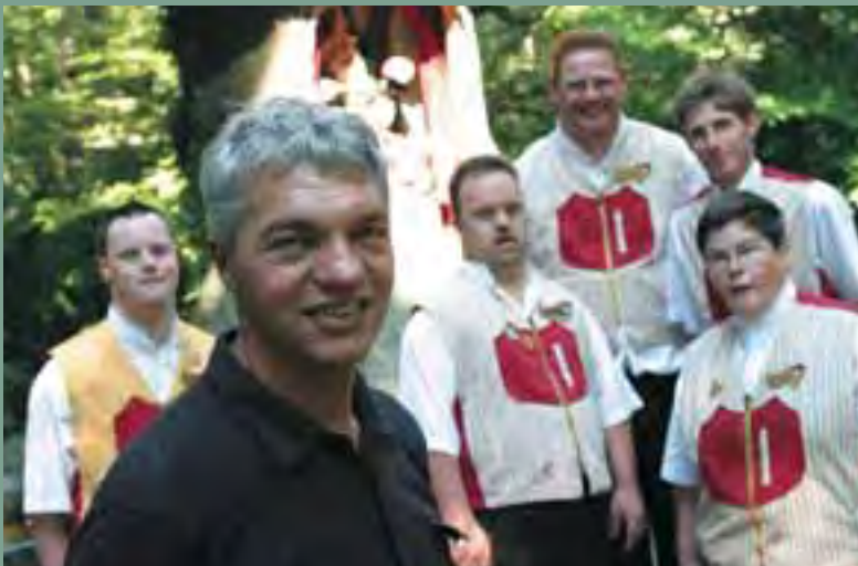
De wonderse wereld van het werken bij de Efteling.