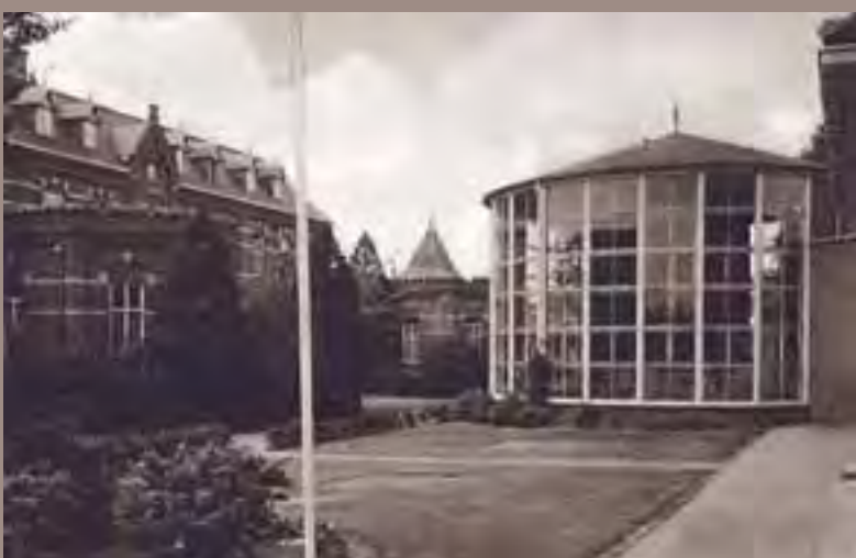
De befaamde Koepel (wintertuin) van het Jozefpaviljoen. Qua arbeidsomstandigheden niet ideaal, het kon er bloedheet zijn.