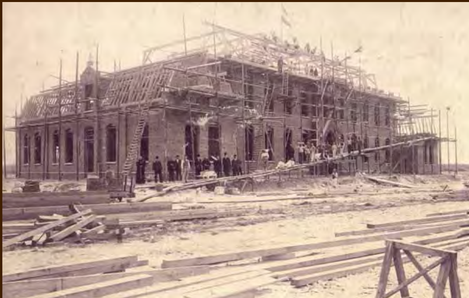
1903 het hoofdgebouw in de steigers