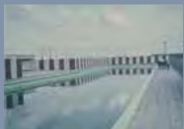
Van zwembad tot manege in vier bedrijven.

Aankomende De vereniging van management-adviseurs heeft de bond van de Nederlandse Vereniging van Arbeiders (NVA) eist om de ontslagen van Assisië te intrekken. De bond heeft de ontslagen van Assisië als 'onrechtmatig' beschouwd.