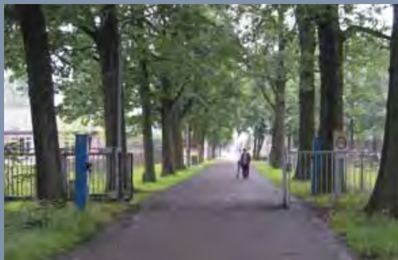
Als regionaal zorgcentrum stelt Assisië haar poorten meer en meer open voor mensen met een verstandelijke handicap uit de regio. Ook in omgekeerde richting wordt het verkeer intensiever: bewoners van Assisië werken en recreëren steeds vaker buiten het terrein in Biezenmortel. De nieuwe visie: het burgerschap, sluipt ook binnen einde jaren '90.