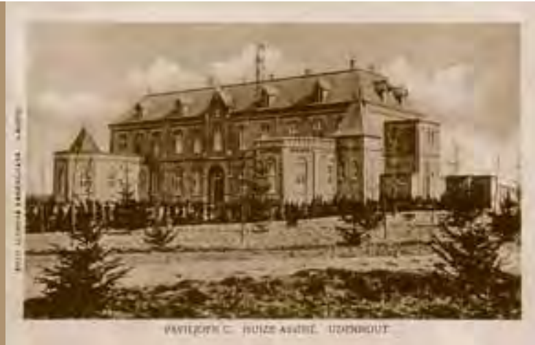
1904, het hoofdgebouw.