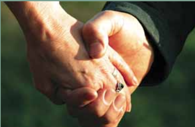
Seksualiteit betekent ook intimiteit.