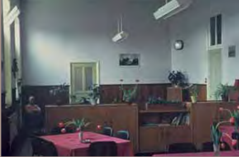
1973, dagzaal Fransiscuspaviljoen.

De invoering van de AWBZ Tot 1968 is Assisië een stil binnenwater. Daarna komt Assisië in woelig water terecht. Een belangrijke gebeurtenis in 1968 is de invoering van de AWBZ. De Algemene Wet Bijzondere Ziektekosten geeft elke zwakzinnige, los van het inkomen van zijn ouders, recht op een volledige vergoeding van het verblijf in de inrichting. Er komt meer geld waardoor de zorg, die lang stil stond, zich weer kan ontwikkelen.