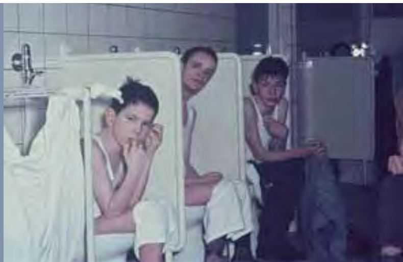
1970, toiletgroep Jozef 2. Grote groepen en weinig personeel resulteerden in groepsbenadering: allemaal tegelijk wassen, naar de w.c., eten, wandelen, op uitstapje.

in grote zalen en overdag was er maar één ruimte die diende als eetzaal, zithoek en televisiekamer. De bewoners zaten de hele dag op elkaars lip, wat vaak tot spanningen leidde.