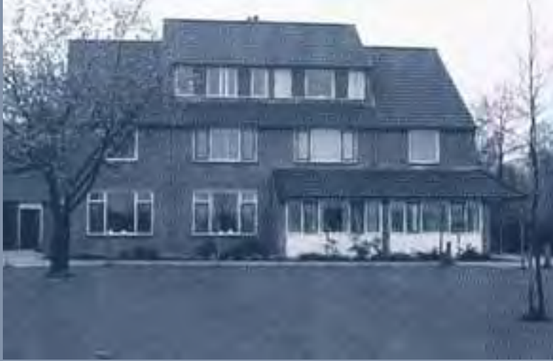
Stop buitenplaatsingen Deze in december 1987 gereed gekomen sociowoning aan de rand van het terrein vormde het compromis tussen de voorstanders van buitenplaatsingen, de groepsleiding en het paviljoen-begeleidingsteam en anderzijds de

groot naar klein, van massaal naar intiem, van zaal naar eigen slaapkamer! Het was huiselijk en we kregen meer persoonlijke aandacht. Dat was een ongekende luxe."