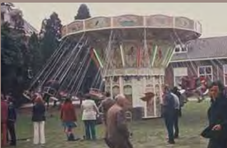
De jaarlijkse kermis Tot de mooiste momenten in de inrichting horen de gezamenlijke feesten met bewoners, medewerkers en ouders. Ze geven een ritme aan het jaar. In deze feesten komt het idee van leefgemeenschap zijn duidelijk naar voren.