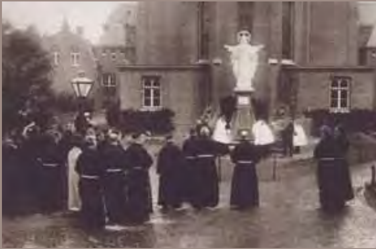
De broeders Penitenten: dienende liefde in franciscaanse eenvoud. Een bijzondere congregatie die zich vanaf 1832 bezig hield met de verpleging van psychiatrische patiënten en verstandelijk gehandicapten.