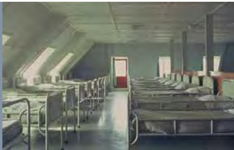
Tot 1983 Slaapzaal Antonius voor 50 bewoners. De oude gebouwen waren absoluut niet meer toereikend om aan de veranderende zorgvragen tegemoet te komen. Ze waren te klein en er was geen enkele privacy. Bewoners sliepen

ontwikkelen, kleinschaligheid, regionalisatie, integratie