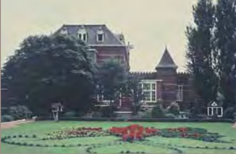
1970, tuin Maria 5.