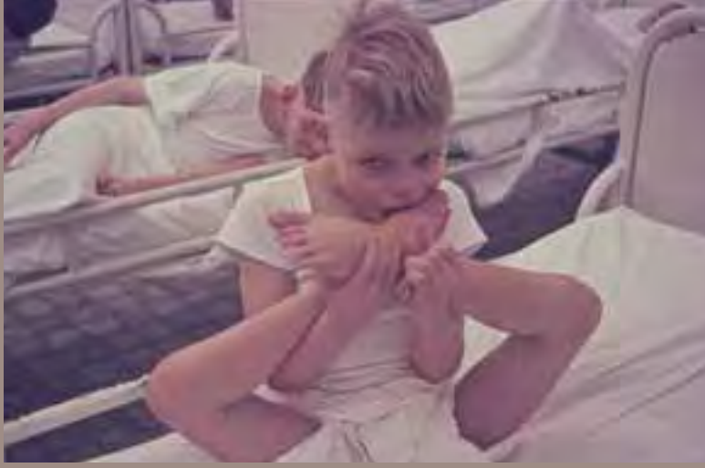
Activiteiten voor bedlegerige bewoners worden pas in de jaren tachtig ontwikkeld. Bij gebrek aan speelgoed wordt het eigen lichaam gebruikt.