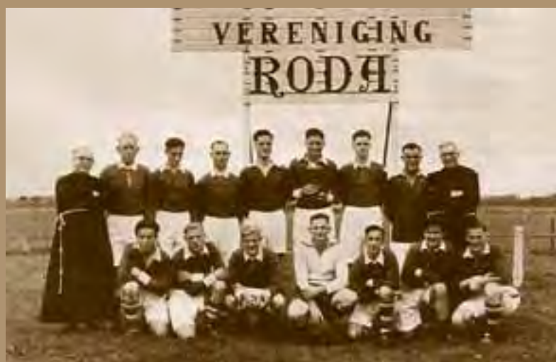
In 1922 had Assisië zijn eerste elftal en voetbalveld. De naam van de voetbalclub is nogal eens veranderd. Allereerst TOP (Tot Ons Plezier). Dit werd EMM (Eendracht Maakt Macht). In 1951 werd het RODA (Recht Op Doel Af). Er werd in competitie gespeeld met andere inrichtingselftallen uit Brabant.