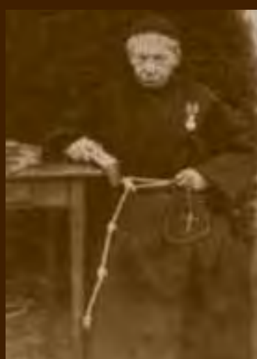
Vader Lucas, tweede stichter van de Congregatie. Besloot tot oprichting van Assisië.