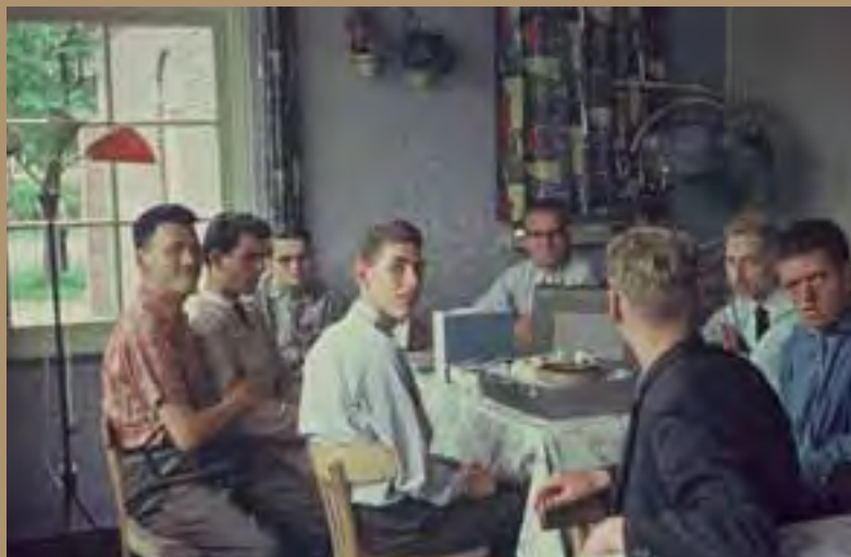
± 1960, hobbyruimte bij Pauluspaviljoen.