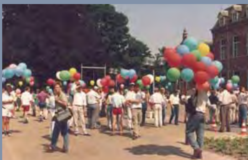
1989, festiviteiten voor het 85-jarig bestaan.

Uit mijn dagboek, 17 januari 1982. Eindelijk: ik krijg een eigen kamer! Ze gaan de grote paviljoens slopen en ik word bewoner van een kamer van mezelf. Assisië gaat op een vakantieoord lijken. Met kleine huisjes, een manege, restaurant, café, toneelzaal, voetbalveld en een kinderboerderij. Alle bedrijven verdwijnen, behalve de keuken en de wasserij.