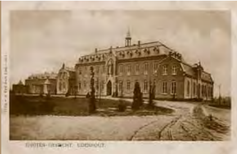
1909, Maria paviljoen.