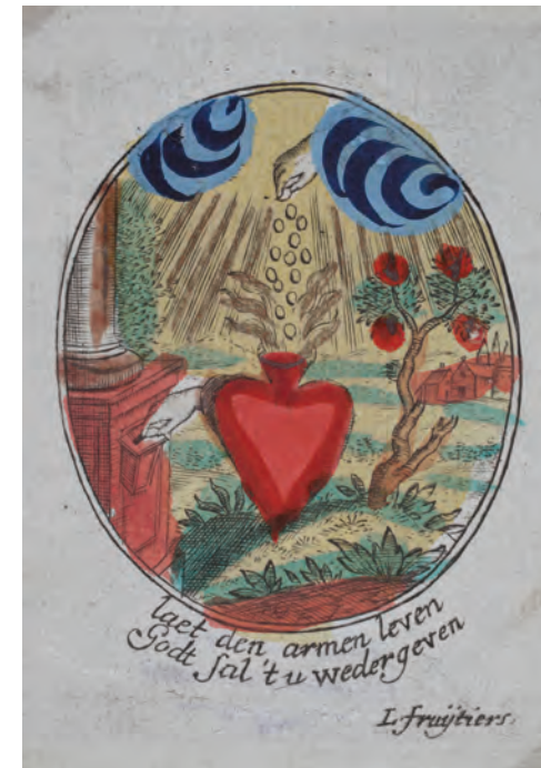
Laat den armen leven, godt sal 't u wedergeven. Gekleurde gravure gesigneerd door L. FRUIJTIER. Universiteit Antwerpen, Ruusbroecgenootschap, Zinnebeelden, Hart, nr. 7:53:1.

heidsinstellingen. Het steunen van deze instellingen, en dus het “naleven” van de caritas, zal op de dag van het Laatste Oordeel in rekening worden gebracht, zoals in het Evangelie volgens Matteüs (25:31-46) benadrukt wordt. Paulus’ verwoording van caritas is wellicht de bekendste, maar ook in de tweede Brief van Petrus werd de naastenliefde krachtig verwoord: “Doe daarom uw uiterste best om uw geloof te voeden met deugd, de deugd met kennis, de kennis met zelfbeheersing, de zelfbeheersing met standvastigheid, de standvastigheid met vroomheid, de vroomheid met broederliefde, en de broederliefde met liefde voor allen” (2 Petrus 1, 5-7).