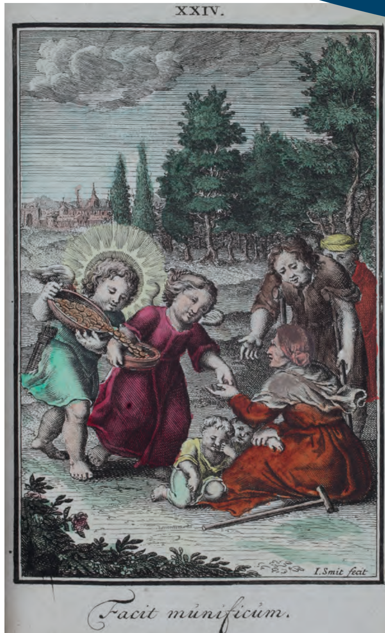
OTTO VAN VEEN & JAN SUDERMAN, De godlievende ziel vertoont in zinnebeelden. Amsterdam, Balthazar Lakeman, 1727. Universiteit Antwerpen, Ruusbroecgenootschap, RG 3118 F 9.