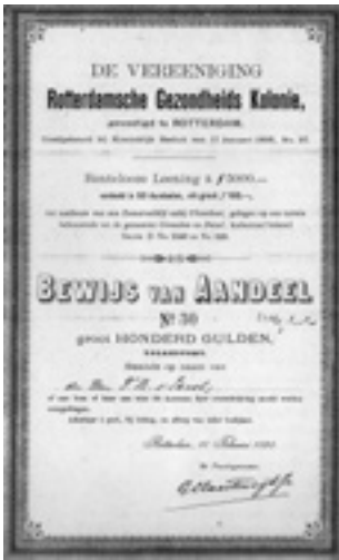
Aandeel voor de bouw van een nieuw vakantiehuis voor Rotterdamse kinderen - 1895