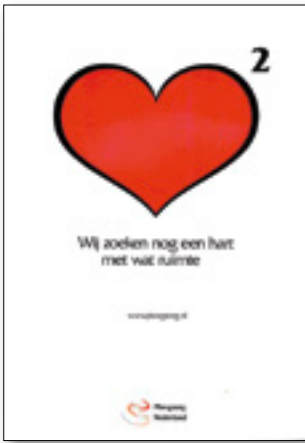
Campagne werving pleegouders in 2009