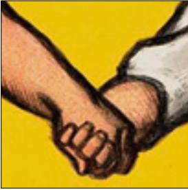
Affiche Zandbergen uit 1915

GEZINSVERPLEGING - KINDERWETTEN - NATUURLIJK MILIEU - DEELTJIDPLEEGZORG