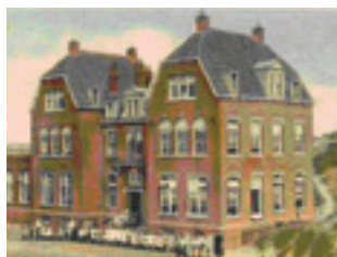
Emma Kinderhuis in Wijk aan Zee.

boven: Utrechtse kinderen voor het station op weg naar een koloniehuis - omstreeks 1900