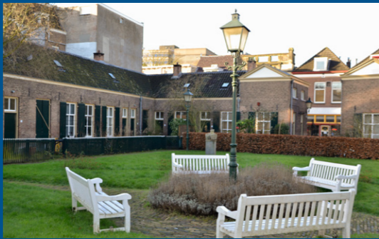
2 – Het Luthers Hofje, huisvesting ouderen – 1860