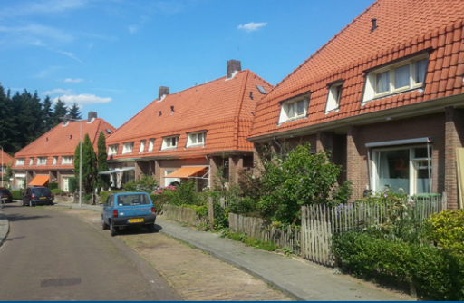
12 – Vogelwijk, woningwetwoningen – 1920