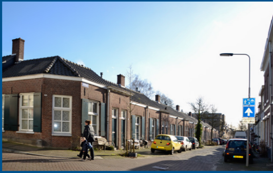
5 – Paulstraat, commissiewoningen – 1865