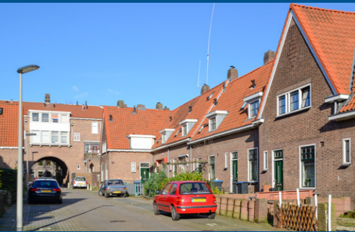
14 – Borgardijnstraat, museumwoning – 1921