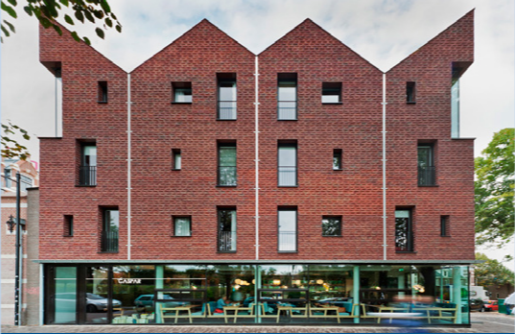
18 – Mode design hotel Modez – 2012