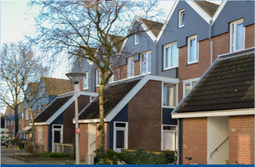
8 – Rappardstraat, stadsvernieuwing – 1975