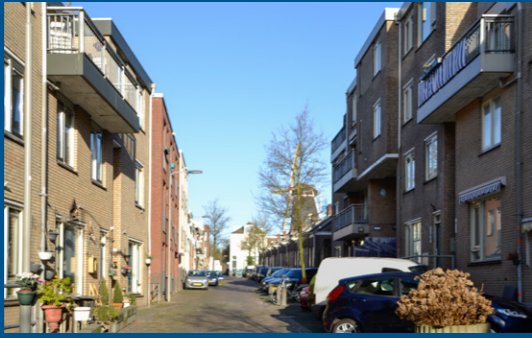
6 – Paulstraat, stadsvernieuwing – 1984