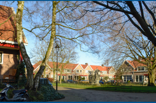
11 – Mussenbuurt, woningwetwoningen – 1910