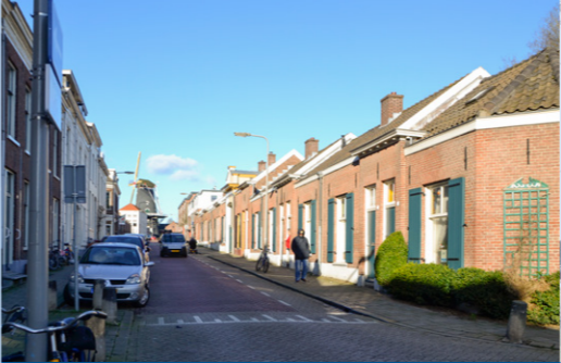
17 – Catharijnestraat, St Petershofjes – 1866