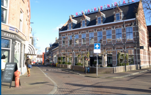
1 – Station Klarendal, 'goed.' proeven – 1887/2008