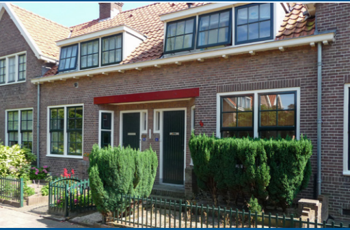
13 – Talmaplein, woningwetwoningen – 1916