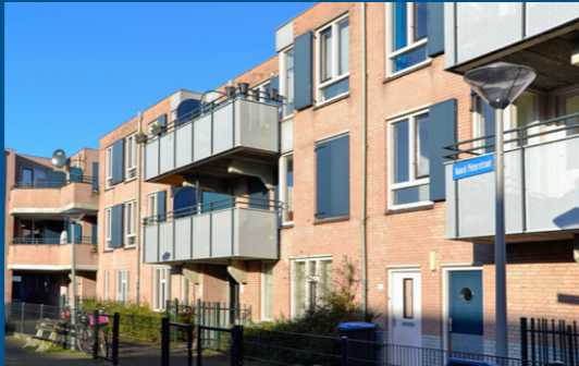
3 – Peterbuurt, stadsvernieuwing – 1987