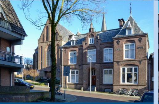
9 – St Jan de Doperkerk – 1895