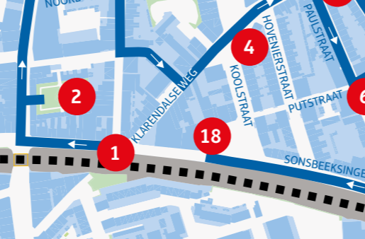
18 – Sonsbeeksingel, stadsvernieuwing – 1975