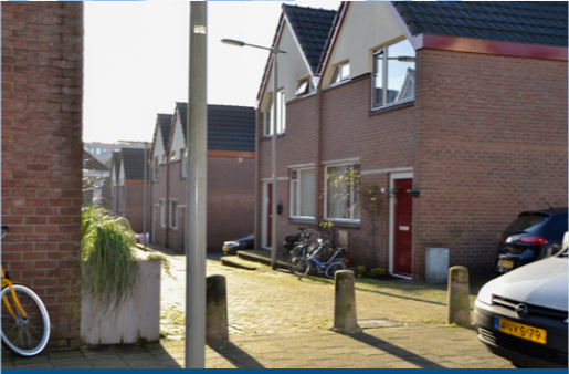
7 – Nijverheidsstraatjes, stadsvernieuwing – 1975