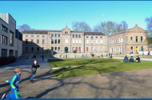
10 – Menno van Coehoornkazerne – 1885