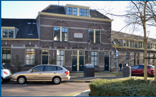
4 – Hoveniersstraat, arbeiderswoningen – 1897