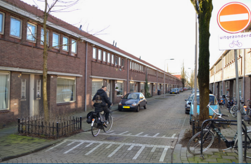
15 – Kapelbuurt – 1930