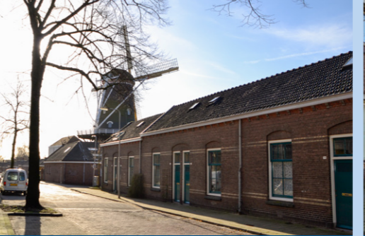
16 – Korenmolen De Kroon – 1870