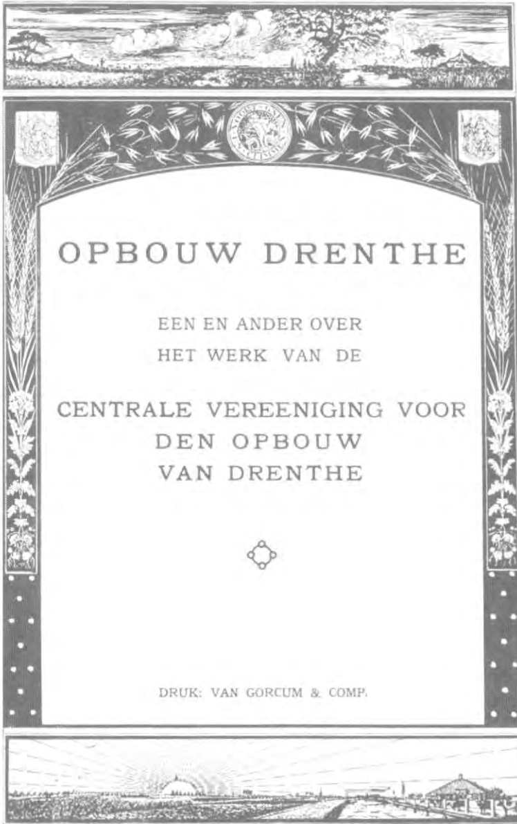
Omslag van de Opbouw-brochure uit 1929

bodemloze put van ellende en armoede zou zijn waar geen vooruitgang werd geboekt. In een slotwoord vermeldt de brochure: "Ons streven [van de Centrale Vereeniging] is om de bevolking zelf in staat te stellen de nu nog steeds armoedige streek meer en meer om te scheppen in een wereld waar de arbeid in rijke mate zijn vruchten oplevert". 42