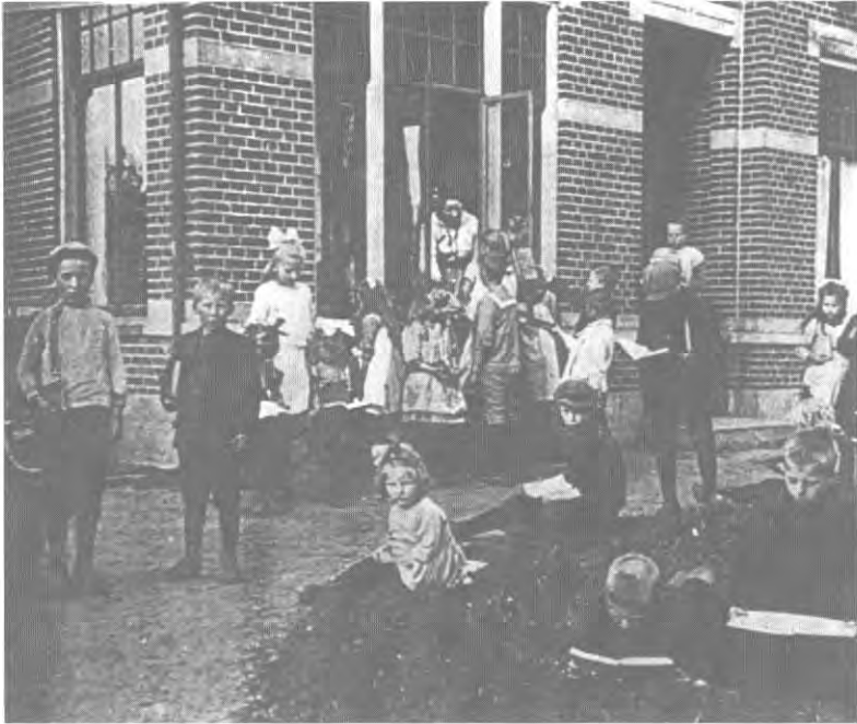
Bibliotheek in dorps huis

alleen de middenstand gebruik van het dorps huis. De allerarmsten en de allerrijksten meden het dorps huis. In de praktijk was de reikwijdte van het dorps huis beperkt, maar als voorstel tot verheffing van het platteland had het wel succes, mede door haar connecties met Amsterdam en Knappert en een goede pers.