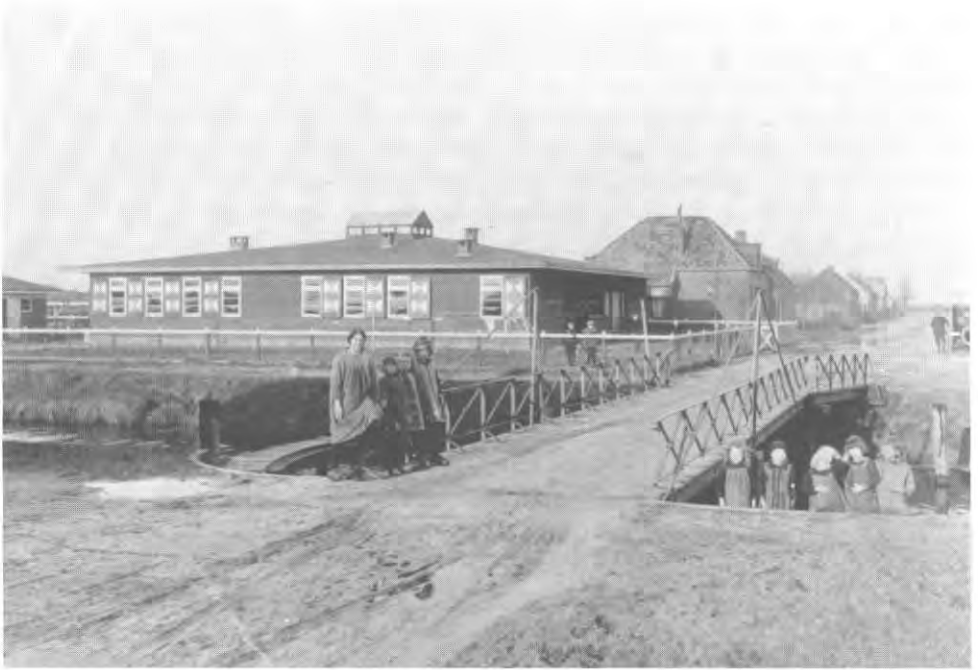
Buurthuis Zwartemeer 1927

opzicht een eigenaardig, op zich zelfstaand gegeven dat zoals gezegd geen equivalent kende en daardoor met de nodige argwaan werd bekeken door de plaatselijke bevolking. Toch probeerde men in Assen een band te smeden tussen het buurthuis en de plaatselijke bevolking, aangezien het initiatief op den duur door de lokale bevolking zou moeten worden overgenomen. Om acceptatie te bevorderen werden zogenoemde Commissies van Toezicht ingesteld om de betrokkenheid bij het buurthuis te stimuleren. Deze commissies moesten met de buurthuismedewerksters zorg dragen voor het programma van het buurthuis. Alle vier buurthuizen kregen een dergelijke commissie. Ze markeerden de overgang van overheidsbemoeyenis naar particulier initiatief. Op den duur zouden de commissieleden als vertegenwoordigers van de plaatselijke gemeenschap de taak van de (provinciale) overheid in de vorm van de Centrale Vereeniging, moeten overnemen en zich garant stellen voor het voortbestaan van 'hun' buurthuis dat uiteindelijk tot een dorps huis zou moeten uitgroeien, het nieuwe sociale en culturele centrum van de lokale gemeenschap.