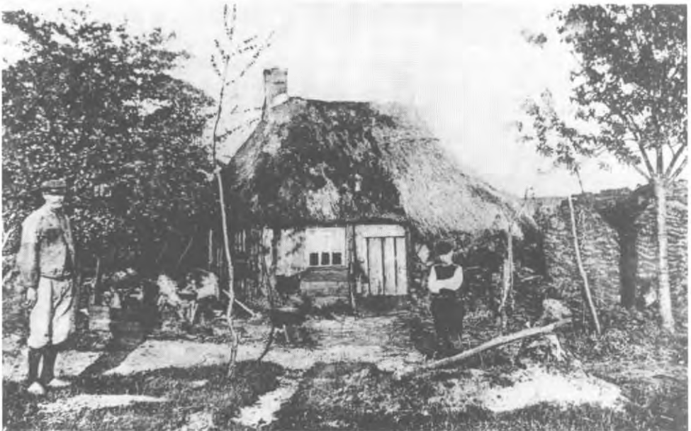
Voorbeeld van een traditionele plaggenhut

De tweedeling werkte ook door in de representatie van de provincie. Van de zandgebieden kennen we de idyllische schilderijen van onder anderen Sientje Mesdag, Anton Mauve en Julius van de Sande Bakhuyzen. Heidelandschappen met herder en schapen, maar ook liefelijke afbeeldingen van boerenmeisjes aan het werk in de moestuin of afgebeeld terwijl zij het kleinvee voeren. De schilderijen ademen rust, stilte en eenvoud. Het is alsof de tijd stilstaat. Dit was, om de woorden van dichter-schilder Hofdijk nog eens aan te halen, het Egypte van Nederland. De veengebieden daarentegen heetten op een bepaald moment het Drentse Californië. Men vond er dan wel goud, bruin goud, maar van beschaving was nauwelijks sprake.