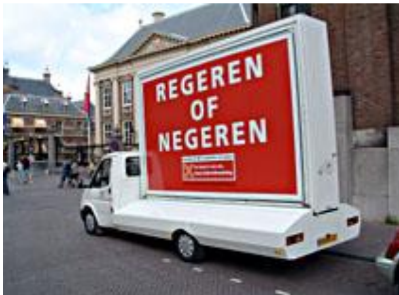
Foto 1. RAAK actie ten tijde van het eerste Balkenende kabinet

Zoals u in voorgaande hoofdstukken heeft kunnen lezen is RAAK er onder zijn voorzitterschap in geslaagd evenwicht te bewaren tussen actie en reflectie. RAAK verdiende prijzen en riep een penning voor verdienste in het leven. RAAK werd een eponiem, dat heden ten dage tot verwarring leidt: zijn het nu RAAK regio's of RAK-regio's waar de centra voor Jeugd & Gezin opgericht worden? [RAK = Regionale Aanpak Kindermishandeling.]