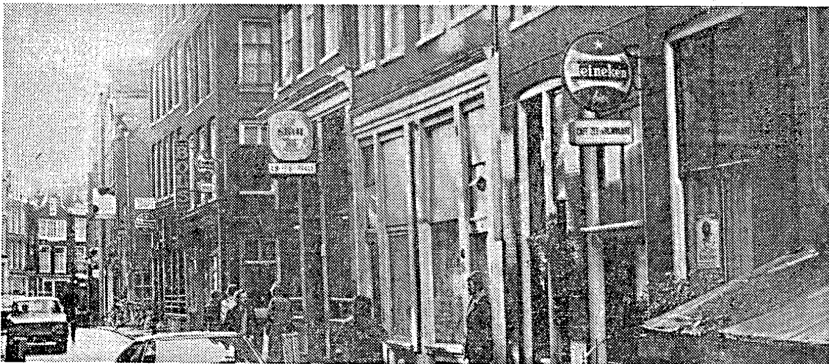
De Zeedijk: ook bloeiende illegale methadonhandel

Op de zwarte markt wordt methadon vooral in pillen verhandeld. De pillen lekken uit het methadonprogramma van de GG en GD of komen bij artsen vandaan. Frits van de Ak-