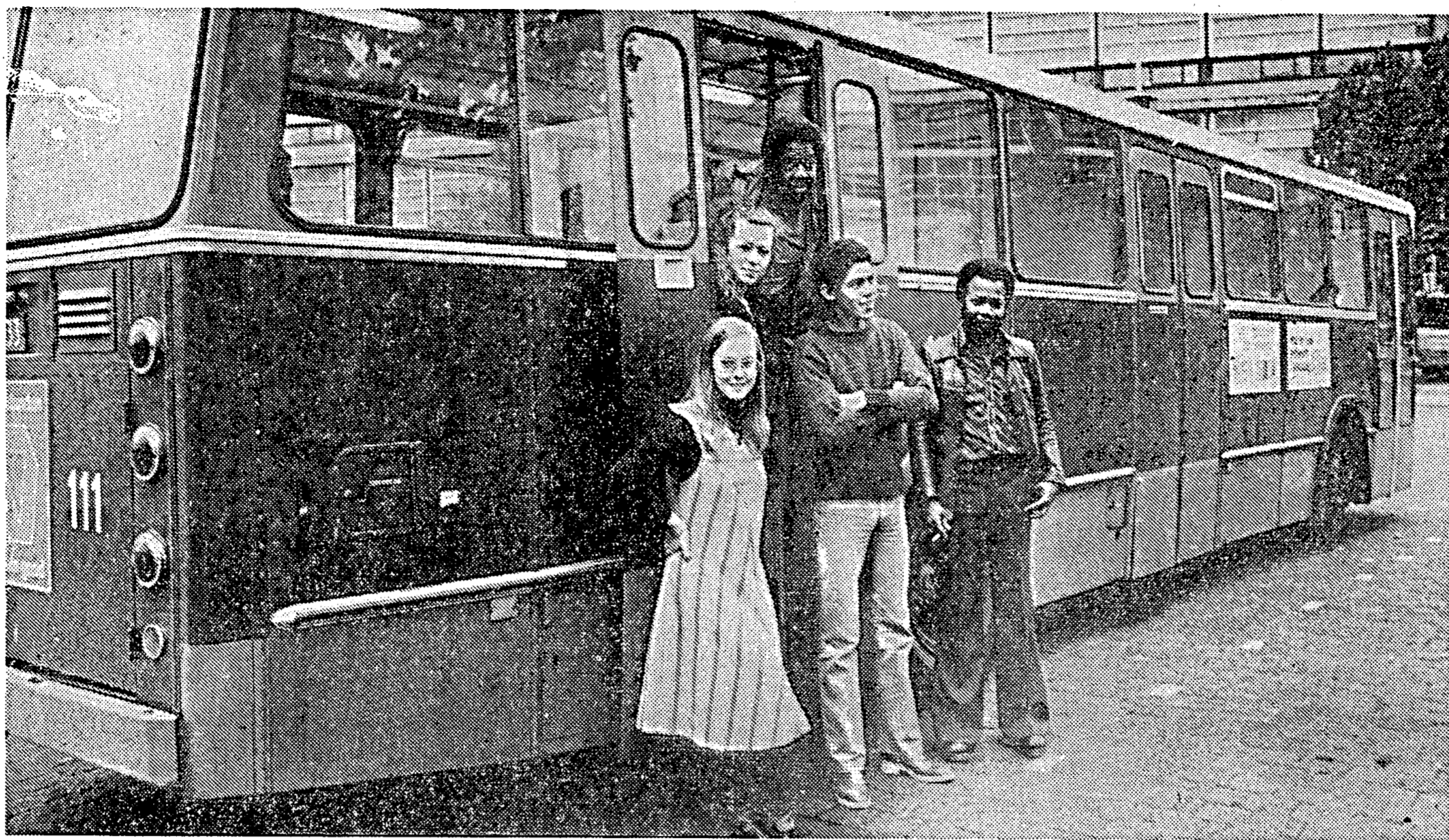
De Rotterdamse methadonbus

Kwasi nonchalant komen groepjes Surinamers aangeslenterd. In de bus krijgen ze een bekertje frisdrank, waarin een dosis methadon is opgelost. Sommigen blijven nog een poosje napraten, maar de meesten zijn na vijf minuten weer verdwenen. Ze kunnen er weer even tegen. Hoeven vierentwintig uur lang niet meer bang te zijn voor onthoudingsverschijnselen. Hebben ook niet meer zo'n behoefte aan heroïne nu.