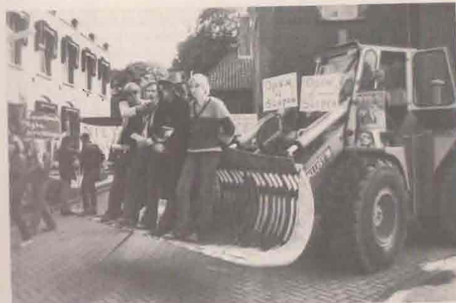
Het zwartboek wordt op hidieke wijze aan de directeur van rijksinrichting Eikenstein te Zeist aangeboden

Een paar keer kwam het voor, dat een door het betreffende tehuis en plaatsende instanties als 'overdreven' bestempelde BM-aanval achteraf volkomen gerechtvaardigd werd door de bevindingen van justitieel onderzoek.