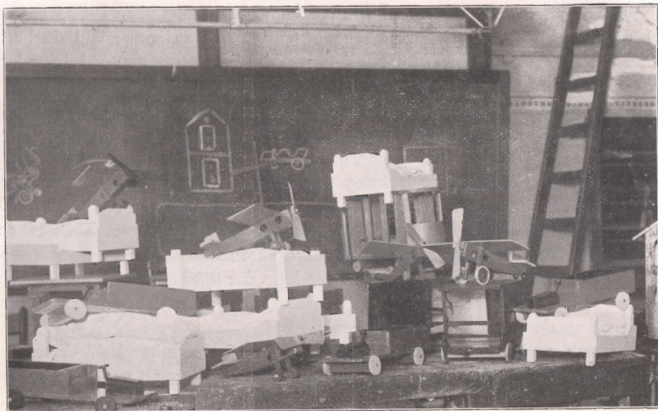
St. Nicolaasspeelgoed door de jongens der hogere klassen gemaakt voor de leerlingen der lagere klassen aan de Hoofthofskade.