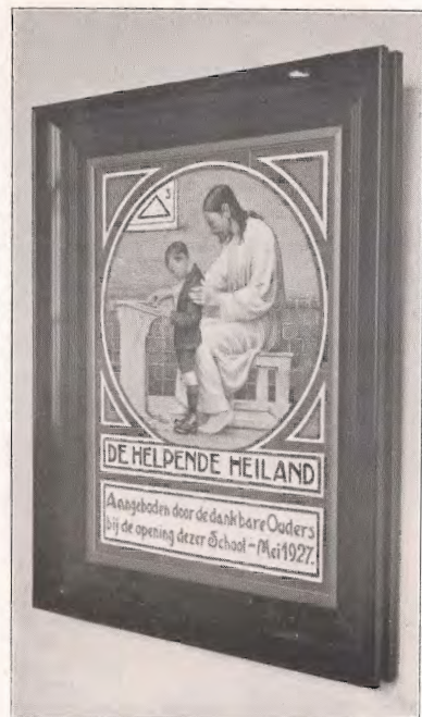
Tegeltableau der ouders.