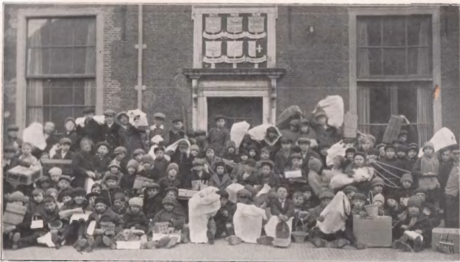
Naar huis met het tentoongestelde werk.