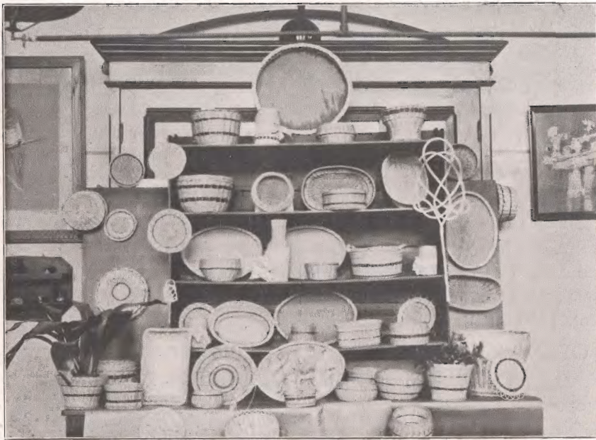
Raffia- en pitrietwerk.

Liggende in een stadsgedeelte, dat voor nieuwe verkeerswegen werd ontruimd, dreigde vermindering der schoolbevolking. Het aantal l.l. blijft ook voor de nieuwe klassen echter voldoende, zoodat de plaats der school ook onder de nieuwe omstandigheden niet ongeschikt blijkt.