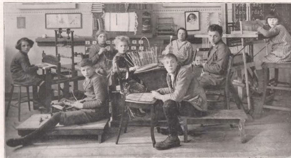
Voorbereiding voor de werkinrichting.

Deze school is voortgekomen uit enkele bezinkingsklassen der school voor B.L.O. aan de Ammuntiehaven (later verplaatst naar Griftstr. 2).