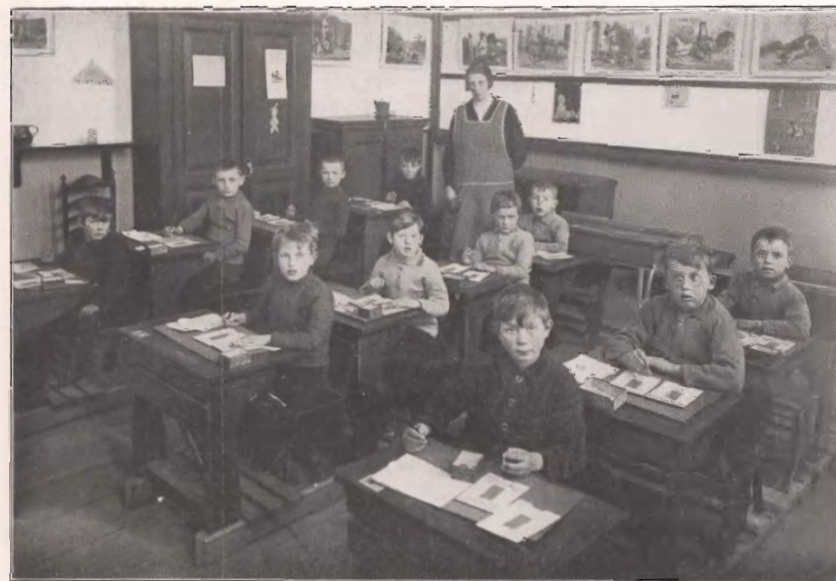
Even kijken naar de lens!

Onze, vooral in de lengte uitgestrekte plattelandsgemeente, hoofdzakelijk liggende langs den straatweg, die van Arnhem naar het noordoosten loopt, heeft het groote voordeel, dat bijna alle dorpen onzer gemeente verbonden