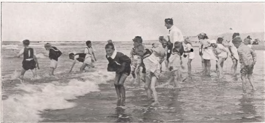
Schoolreisje naar de zee.

De gemeentelijke B. S. v. L. O. te Dordrecht werd opgericht den 1sten October 1911.