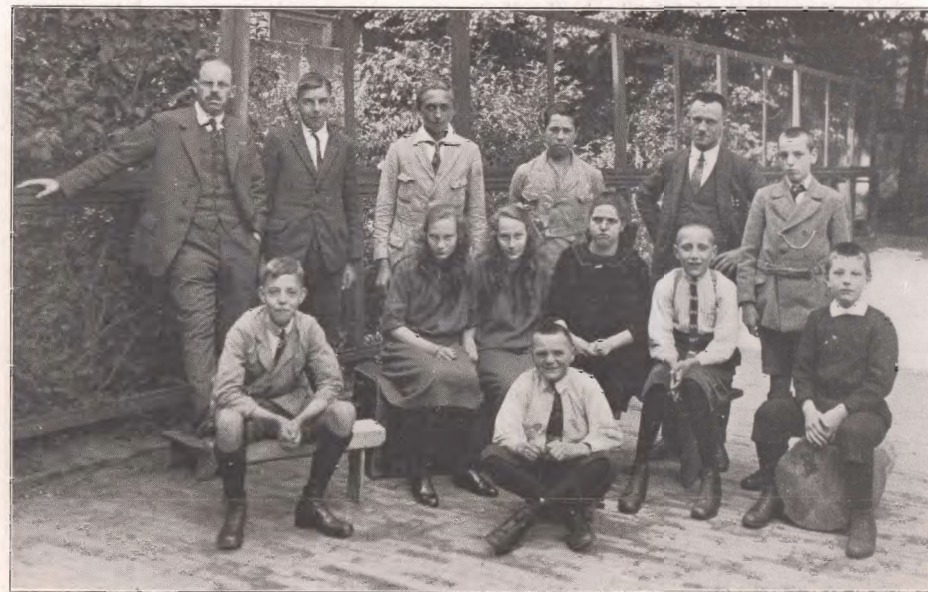
Een hoogste klasse.

Op bijgaande foto, van een vroegere hoogste klasse — met 2 leer-