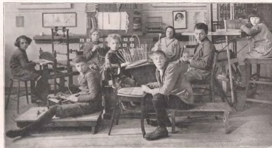
Voorbereiding voor de werkinrichting.

Deze school is voortgekomen uit enkele bezinkingsklassen der school voor B.L.O. aan de Ammuntiehaven (later verplaatst naar Griftstr. 2).