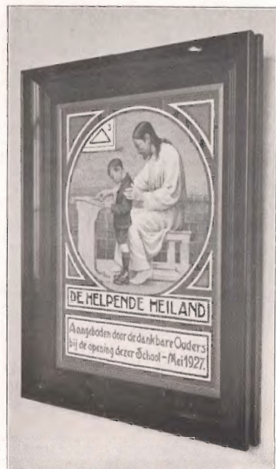
Tegeltafel der ouders.