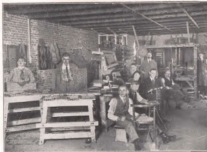
Werkinrichting voor jongens.

Den laatsten tijd trekt de school veel kinderen uit de buitengemeenten. Maassluis zendt er 20; Vlaardinger-Ambacht 3; Maasland, Rozenburg en Nieuwenhoorn elk 1. Het personeel heeft deze opnemings in de hand gewerkt, door vrijwillig in de middagpauze het toezicht op zich te nemen.