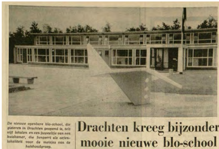
De nieuwe openbare blo-school, die gisteren in Drachten geopend is, telt vijf lokalen en een juweeltje van een huiskamer, die fungeert als oefenlokaliteit voor de meisjes van de huishoudgroep.