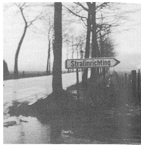
Wegwijzer 'Strafinrichting' naar Merksplas

land verblijven, worden hier tijdelijk ondergebracht. Het gaat om meer dan 30 verschillende soorten nationaliteiten. Verder is er een gebouw voorzien voor een 70-tal mensen die ter beschikking gesteld werden van de regering. De bedoeling van de ter beschikkingstelling van de regering is onhandelbare personen te 'resocialiseren'. Bovendien zijn er ook de primair veroordeelden en recidivisten van lichter allooi. We mogen ook de landlopers niet vergeten, waarvan er ongeveer 350 te Wortel verblijven, in een inrichting die een paar km van Merksplas gelegen is. De rest wordt naar deze laatste inrichting afgevoerd hoofdzakelijk omwille van het onderhoud van de gebouwen. 'Tijdens de oorlog heb ik in een concentratiekamp in Duitsland gezeten, mijnheer, maar dit is erger, geloof me. Het is een schandaal'; de eerste woorden van een ter beschikking gestelde van de regering. Zijn klachten worden jammer genoeg ook bevestigd in gesprekken met andere gedetineerden en in brieven, gericht aan de Liga van de Rechten van de Mens. De gevangenen hebben het hierin over andere gevangenen, die afgetuigd worden door het personeel, vaak omwille van lichte overtredingen van reglementen. Vooral de vreemdelingen en frans-