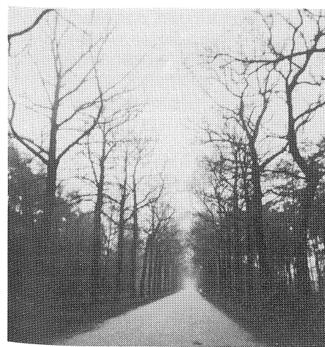
Prachtige dreef van het domein van Merksplas