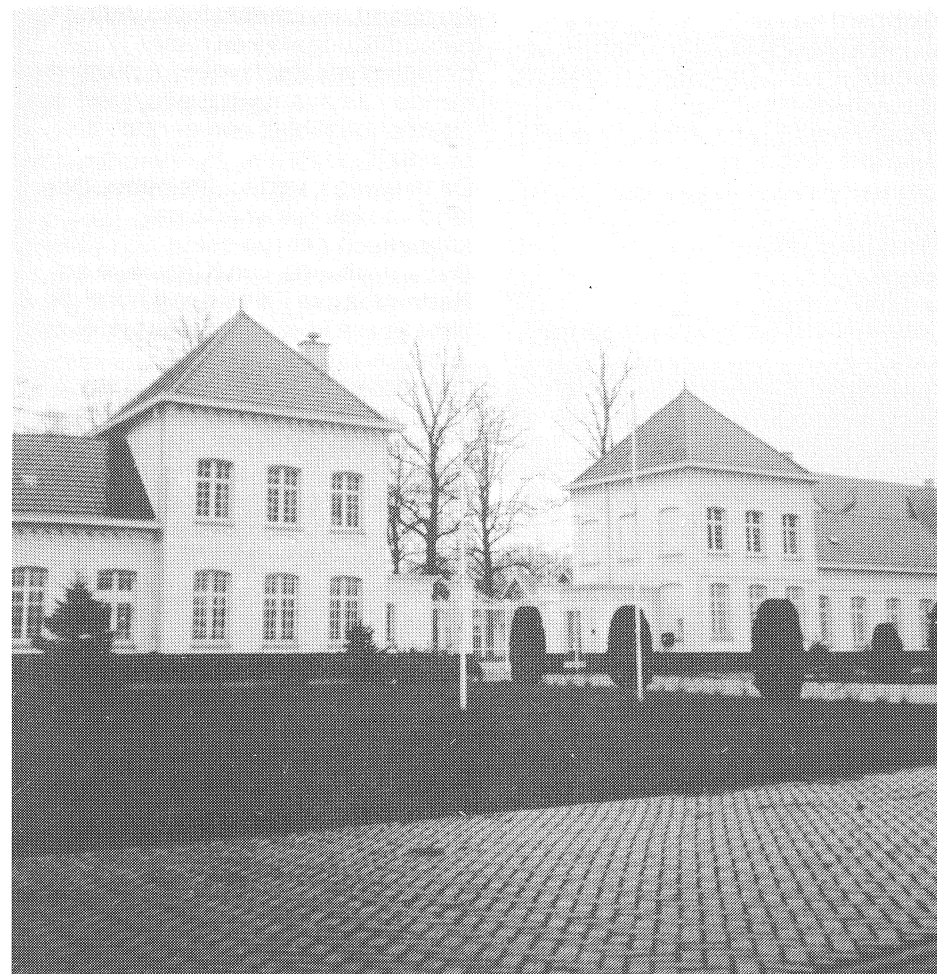
Gebouw van Wortel (landlopers)