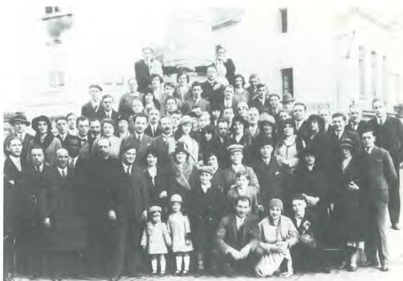
Toneel als volksoopvoeding. Groepsfoto van de toneelkring van de werkmanskring Sint-Augustinus uit 1930.

van Antwerpen. Het wilde de katholieke gedachte en de kunstmaak bevorderen. Door onderlinge steun verwachtte het Verbond levenskrachtigere toneelafdelingen. In overleg met de Algemene Toneelboekery te Brussel, waarmee het in een goede verstandhouding leefde, legde het Antwerpse Verbond lijsten aan van toneelstukken en kocht zelf stukken aan, om ze te kunnen verspreiden onder zijn leden. Het schreef prijskampen uit en organiseerde toneelcursussen, om tot een kwaliteitsverbetering te komen 75 . Ook met het Algemeen Katholiek Vlaams Toneelverbond (A.K.V.T.) onderhield het goede relaties. In 1937 werd de verhouding even vertroebeld door de wens van het A.K.V.T. dat de leden rechtstreeks zouden aansluiten, en niet langer via het A.C.W.