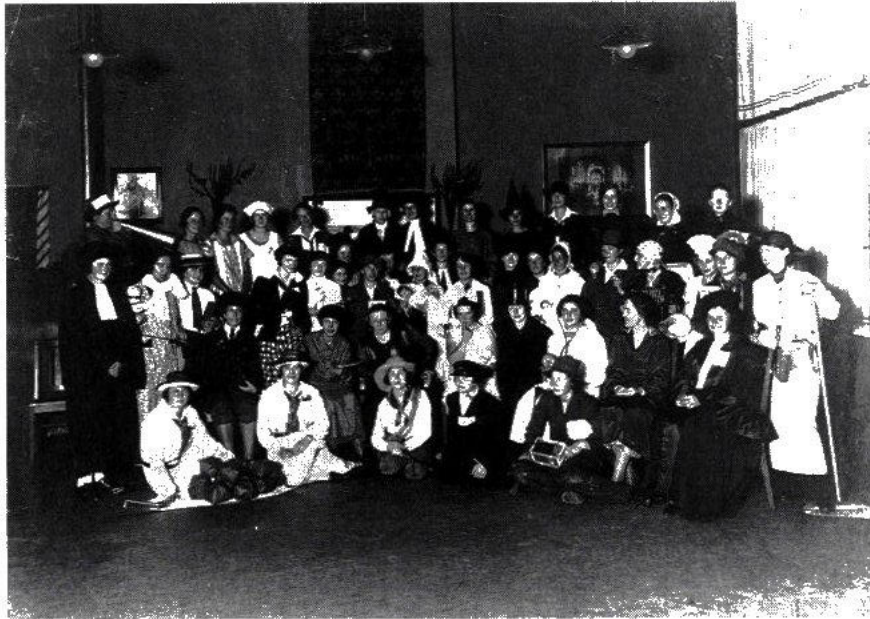
In het tijdperk-Knappert was er meer dan voorheen aandacht voor culturele vorming, zoals toneeluitvoeringen en revues (Collectie IISG).

Ook aan de eenling gaf een werkterrein dat in overeenstemming was met haar aanleg en natuur de meeste kans op vervulling en levensgeluk. Het moedergevoel dat Muller-Lulofs diep in iedere vrouw verankerd wist – het beste wat de vrouwelijke sekse de mensheid te bieden had – diende niet te verschrompelen tot 'egoïstisch zelfbehagen in eigen kleine kringen' en als een allesomvattende liefde 'overgeplant te worden in de grote, smartelijke mensenwereld'. 84