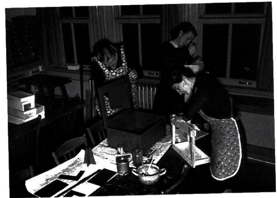
Leerlingen in de bibliotheek en tijdens het handenarbeidonderricht.