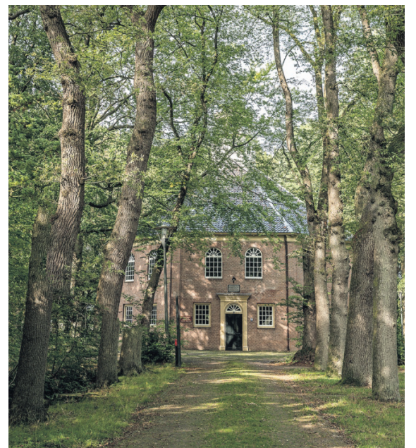
Enkele van de negentig objecten die in het Drentse dorp Veenhuizen te koop staan. Van hotel-restaurant