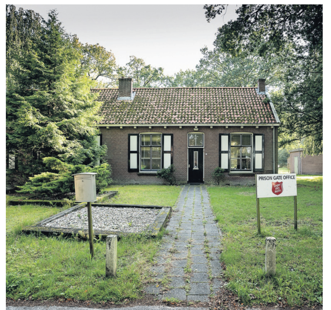
tot telefooncel. Ook is er een kaasmakerij, gevangenis-museum en een ecologische boerderij.

E en Te koop-bord ontbreekt op het gazon voor hotel-restaurant Bitter en Zoet. Rond het Gevangenis-museum aan de Oude Gracht krioelt het evenmin van de verkoopmakelaars met aanrijzende praatjes. Moeite zouden ze er niet voor hoeven doen: 'Panden als spiegels van twee eeuwen maatschappelijke ontwikkeling! Toeristische trekpleister! Staat op de nominatie als Unesco Werelderfgoed!'