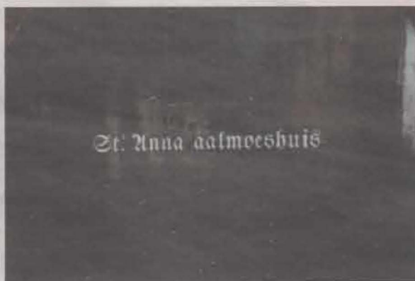
Deur Sint Annahofje, Leiden.