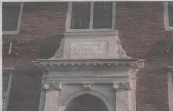
Gevelsteen op de Amstelhof (Hermitage), Amsterdam.