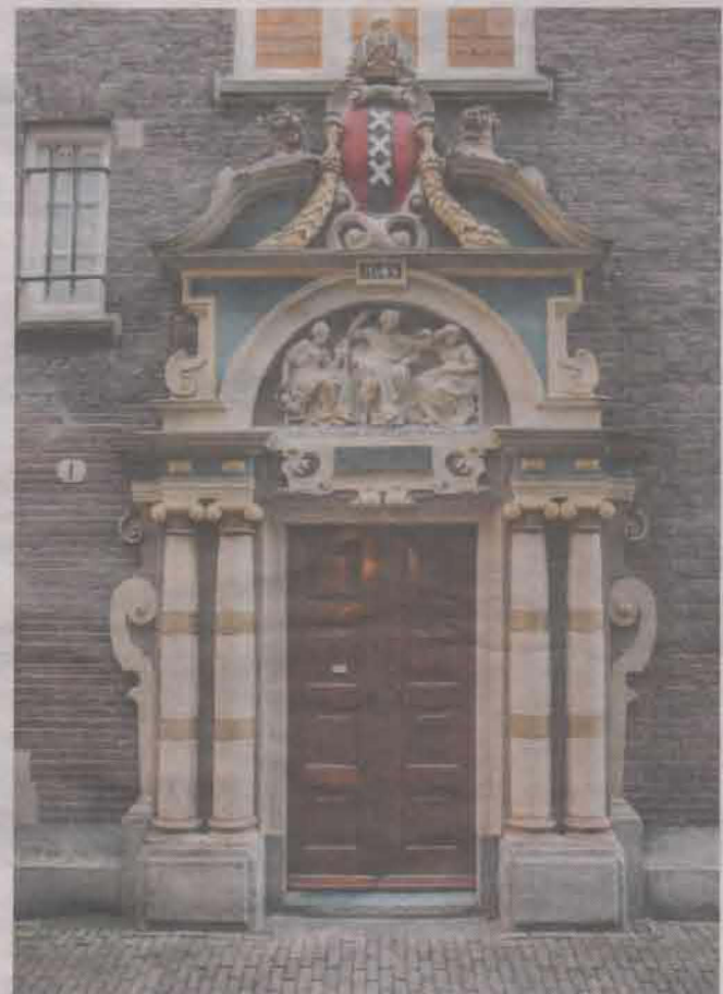
Ingang van het Spinhuis in Amsterdam.