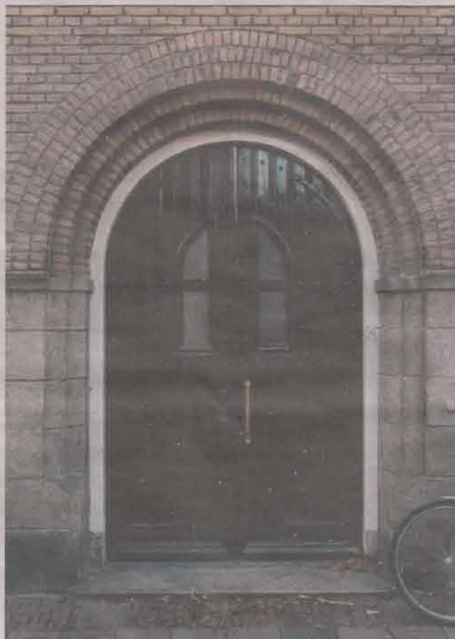
Toegang tot het Sint Annahofje in Leiden.