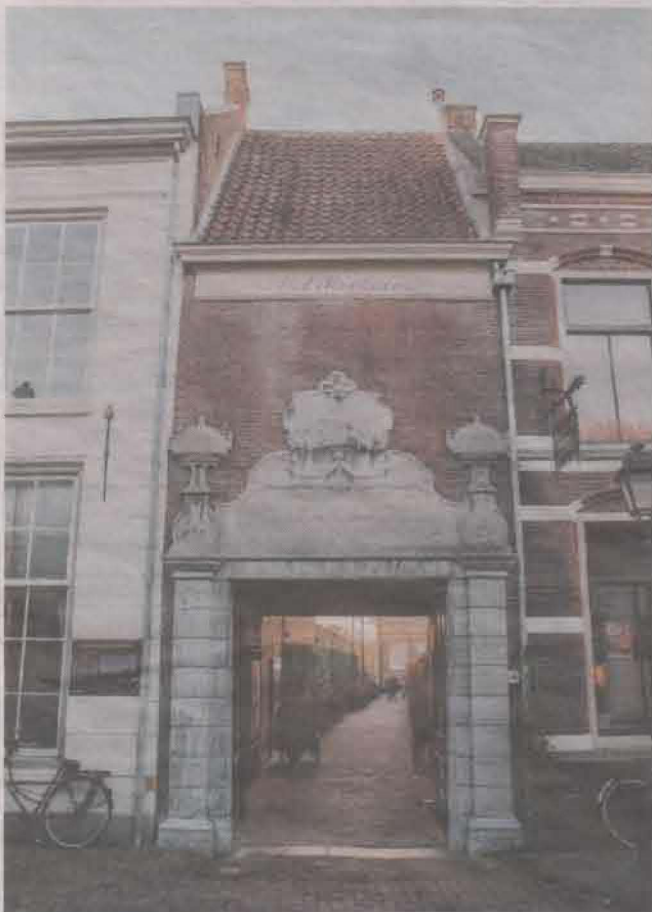
Toegangspoort tot het Elisabeth Weeshuis in Culemborg.

Door Wieteke van Zeil