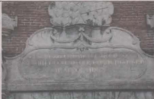
Gevelsteen Elisabeth Weeshuis, Culemborg.