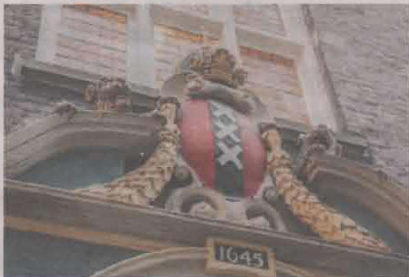
Amsterdams stadswapen op het Spinhuis.

ten zien.' Aan die gewoonte kleefde zware sociale druk: wie nieuw in de elite was, telde mee als hij ook een hofje stichtte of op zijn minst regent werd in een weeshuis of aalmoezeniershuis. En daarmee maakten ze weer reclame voor zichzelf. De weeshuizen hingen vol kunst van de beste meesters: Rembrandt, Ferdinand Bol, Govert Flinck, Bartholomeus van der Helst, enzovoort. Regenten lieten graag hun betrokkenheid zien.