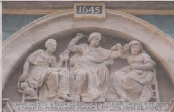
Gevelsteen met gedicht op Spinhuis, Amsterdam.

8 + (2 \times 6) = 20 en (8+2) \times 6 = 60 Het hofje was namelijk gebouwd en ingericht voor twintig vrouwen vanaf 60 jaar.