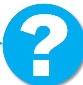
Seksueel misbruik en de commissies-Deetman/Samson