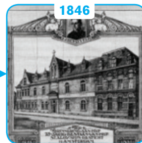
Het Sint Aloysiusgesticht