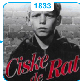
Eerste jeugdgevangenis in Rotterdam