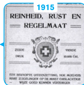
Reinheid, Rust, Regelmaat