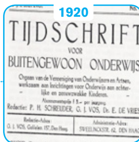
Speciaal onderwijs voor moeilijke kinderen